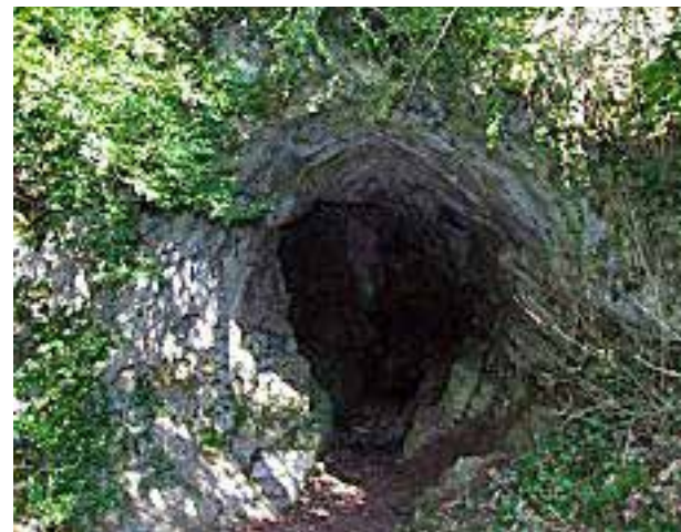
Entrée de la grotte de la Beume

Autour de Brancion, vous trouverez de nombreux chemins jalonnés de souvenirs remontant à la préhistoire, au Moyen Âge et au maquis de Brancion durant la Seconde Guerre Mondiale.