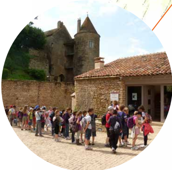
L'arrivée au château