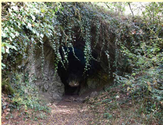
Entrée de la grotte de la Beaume

Autour de Brancion, vous trouverez de nombreux chemins jalonnés de souvenirs remontant à la Préhistoire, au Moyen Âge et au maquis de Brancion durant la Seconde Guerre Mondiale.